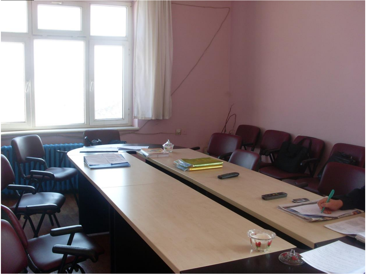
H) Anasınıfının Görünüşü: