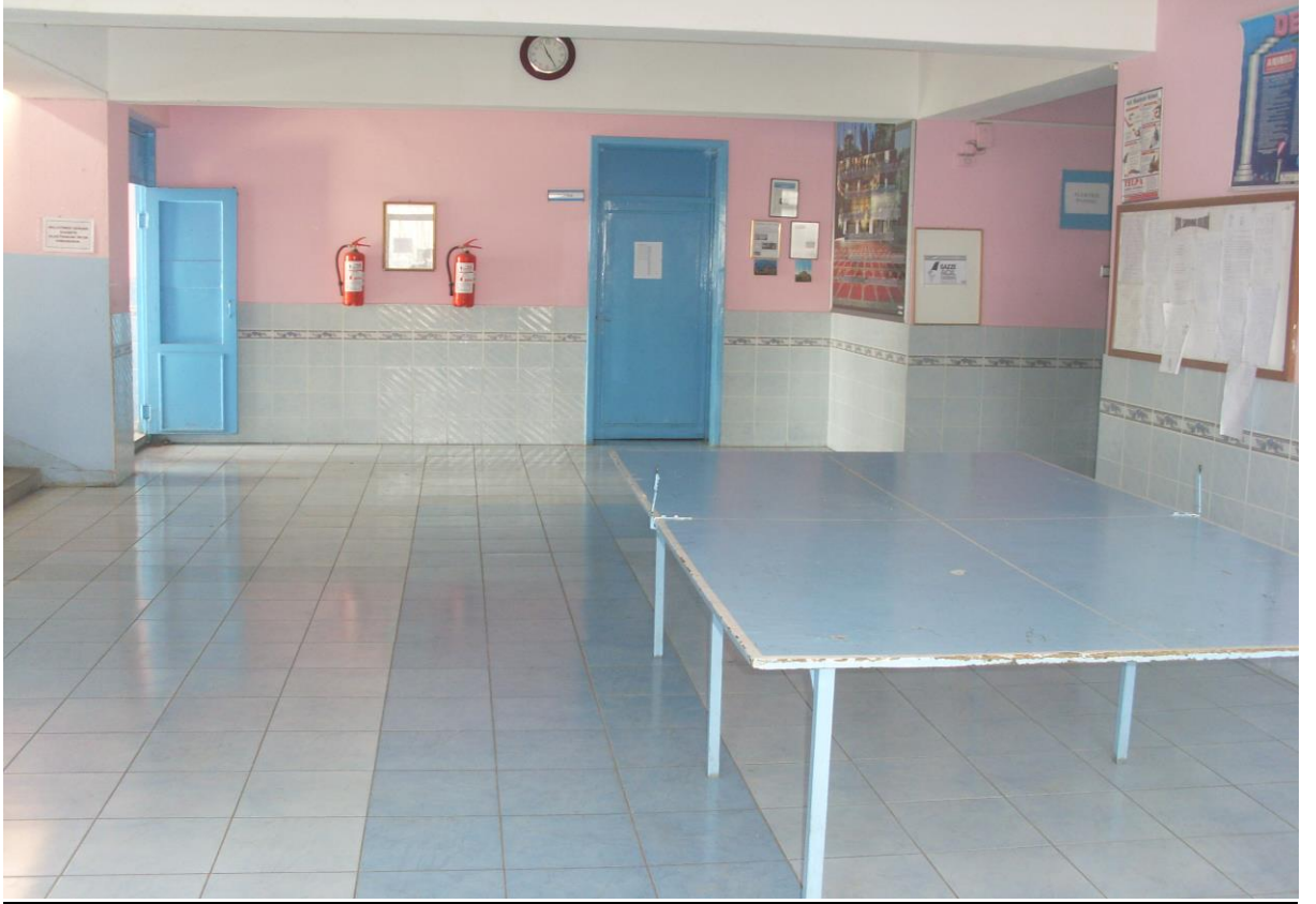
D) Koridorun İçten Görünüşü: